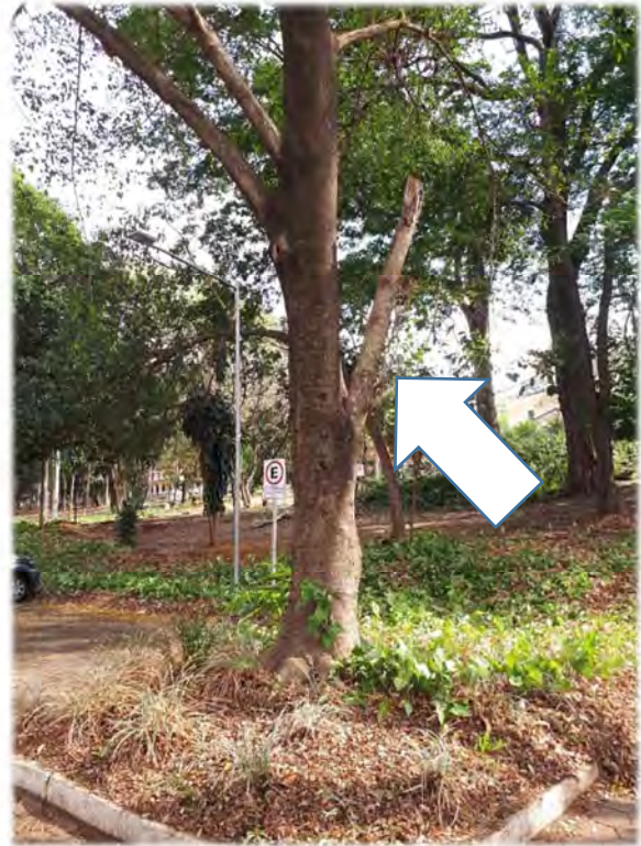
Fig. 2: Estacionamento livre do Bloco A