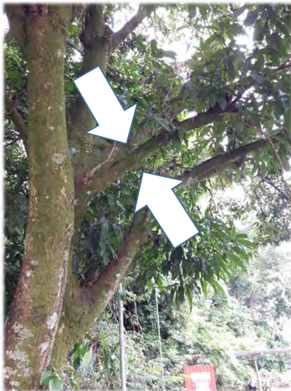
Fig. 3: Mangueira no estacionamento do Bloco C1