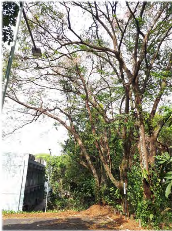
Fig. 1: Estacionamento do Bloco B1